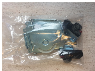
1 stk pakke til hver dør & skruepakke (16mm & 35mm)