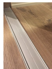
Enkel skinne nede