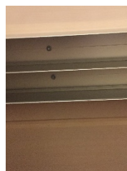
Dobbel skinne oppe