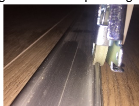
Riktig plassering av hjulene